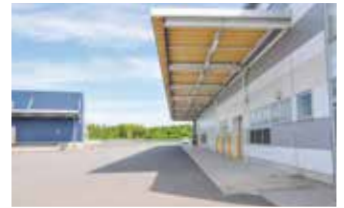
東金物流センター