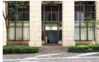
タケダ セールスプロモーション事業部